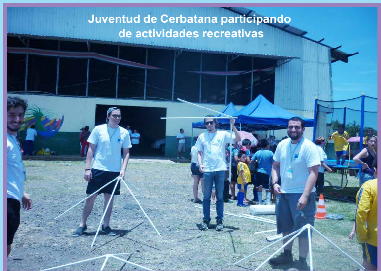
Juventud de Cerbatana participando de actividades recreativas