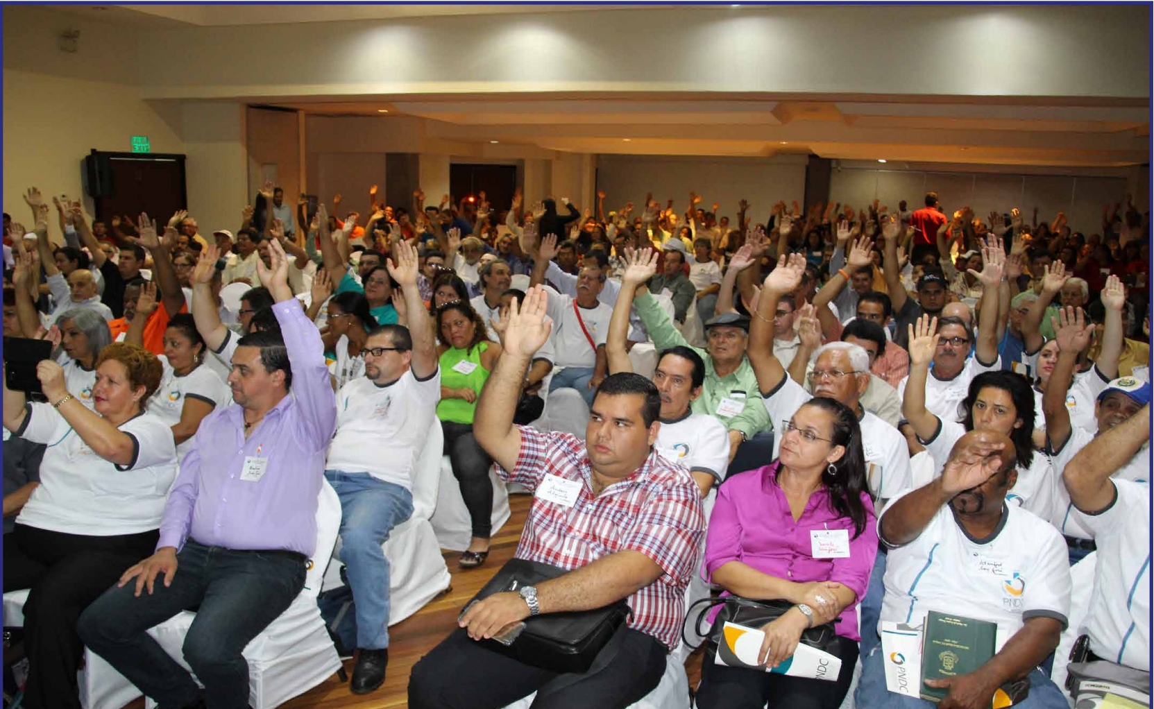
Asistentes al Congreso en el momento en que emiten su voto para aprobar el Plan Nacional de Desarrollo de la Comunidad (PNDC) 2016