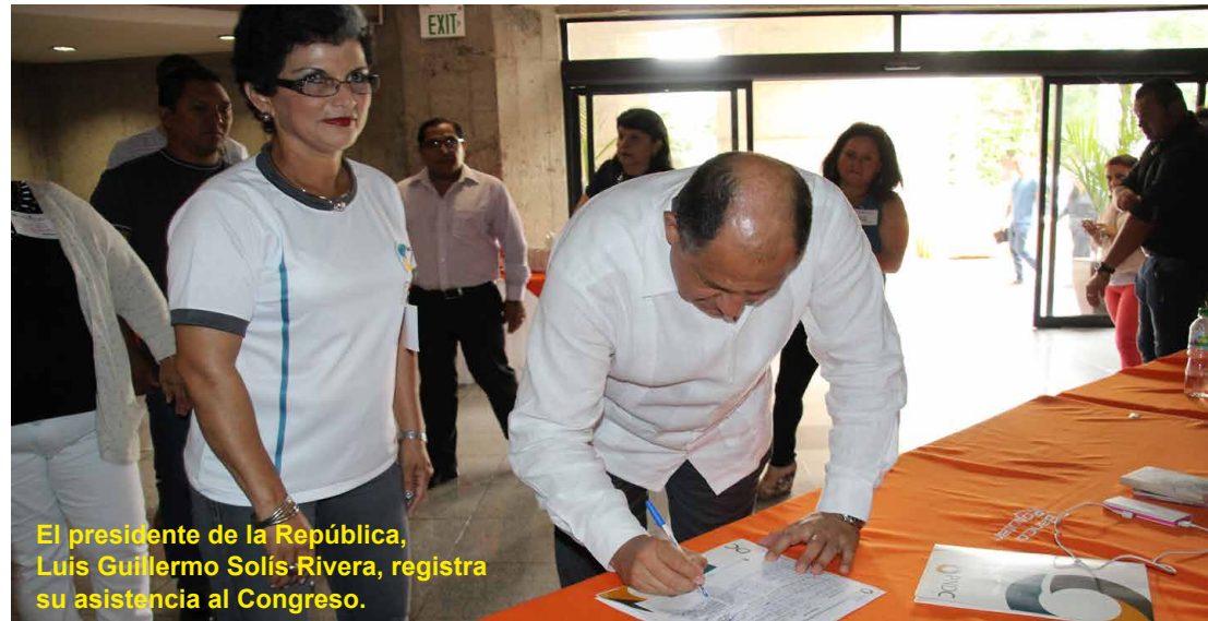
El presidente de la República, Luis Guillermo Solís-Rivera, registra su asistencia al Congreso.

Este ha sido un proceso innovador dentro