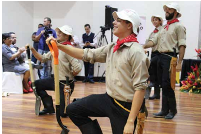
El grupo folclórico "El Gamonal", de la Universidad de Costa Rica, sede Occidente, amenizó las actividades de clausura del VII Congreso Nacional de Asociaciones.