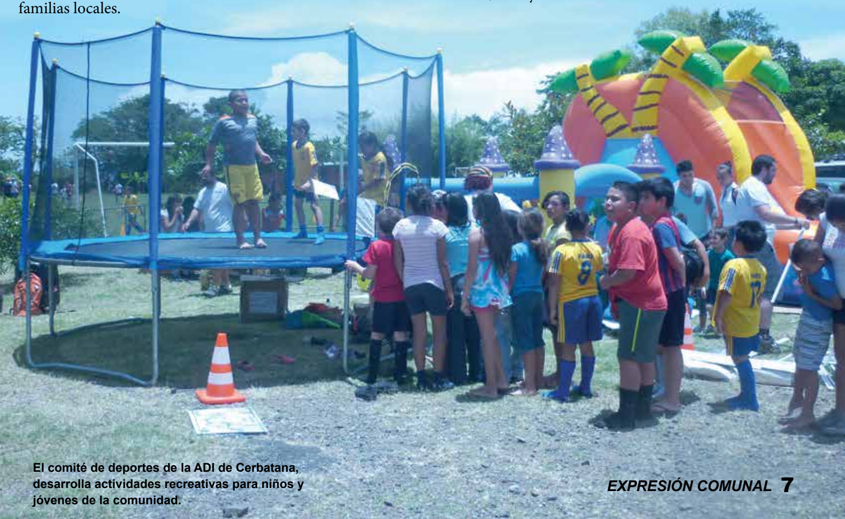
El comité de deportes de la ADI de Cerbatana, desarrolla actividades recreativas para niños y jóvenes de la comunidad.

En resumen, Cerbatana es un bonito lugar para vivir, aseguró la presidente de la asociación y agregó que, si bien, la infraestructura comunal y las calles pavimentadas son logros muy significativos y todavía hay mucho por hacer, lo más importante es el desarrollo humano y poco a poco se empiezan a ver los resultados. La muestra es un mural colectivo que existe en una de las paredes del salón multiusos, en el cual ha participado toda aquella persona que así lo ha deseado, incluyendo los niños.