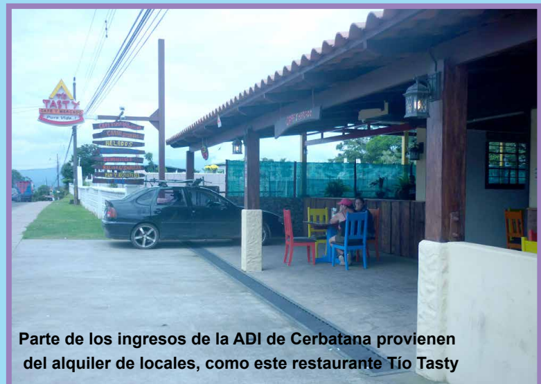
Parte de los ingresos de la ADI de Cerbatana provienen del alquiler de locales, como este restaurante Tío Tasty

Cementado de 300 metros de la calle Linda Vista, con el financiamiento de Dinadeco y la colaboración del Ministerio de Trabajo y Seguridad Social, Ministerio de Obras Públicas y Transportes y el comité de vecinos de esa calle. Igualmente, se logró el lastrado de calle Vieja, calle Los Arley y calle el Bosque, y se le da seguimiento al cementado de calle Antigua, y Don Bosco, en coordinación con la municipalidad del cantón.