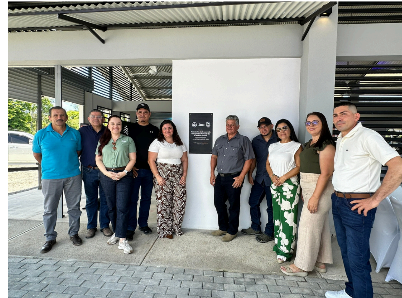
Hub Comunal ADI El Porvenir de la Rita de Pococí