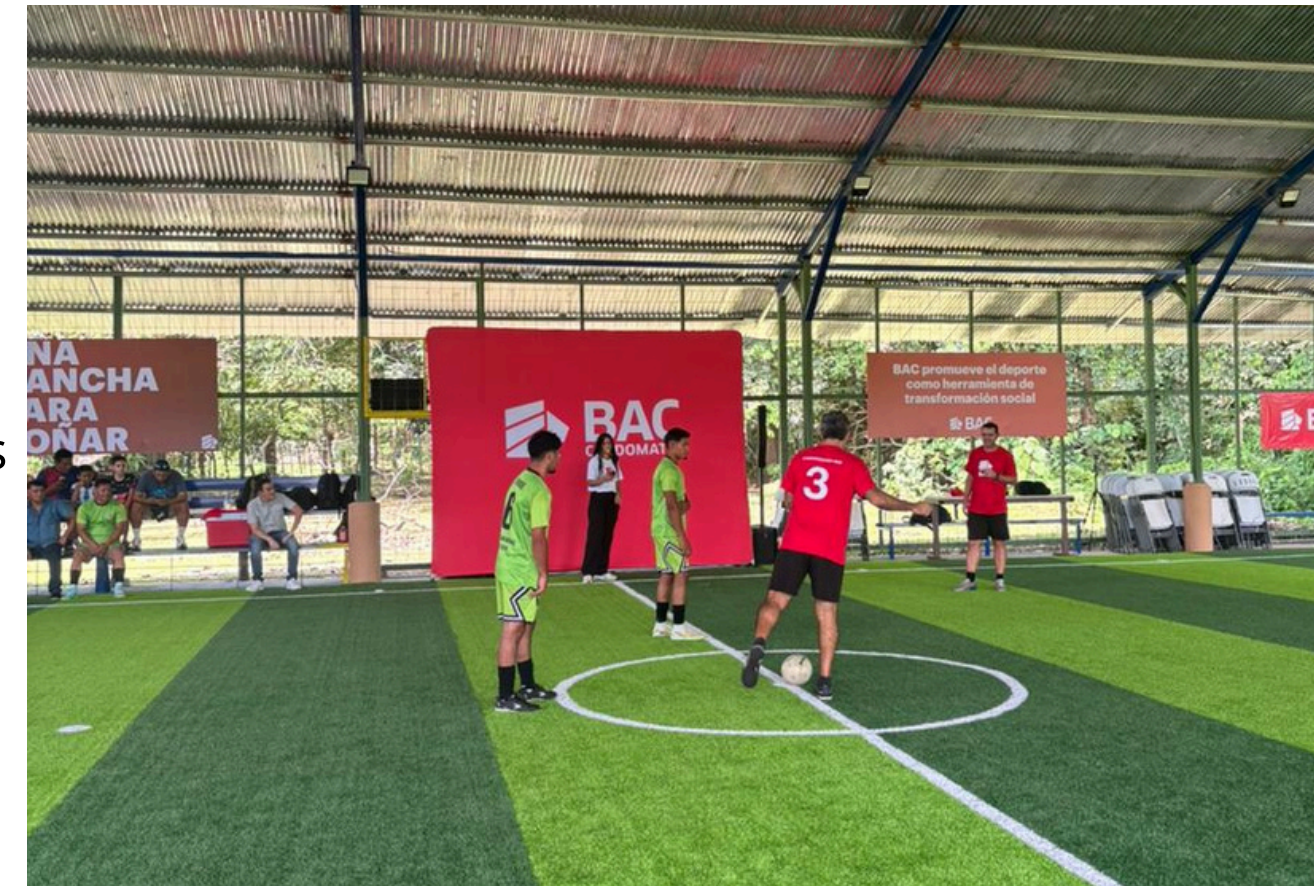
Cancha Sintética ADI Parque Margarita, Sixaola