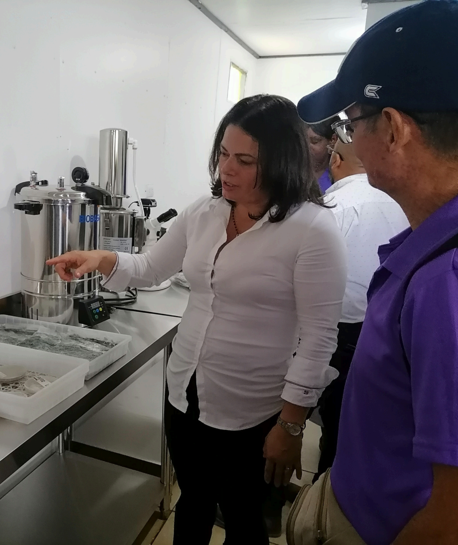
Laboratorio de Bio insumos ADI Tuis de Turrialba

Durante el periodo 2021–2026 , estas alianzas han permitido: