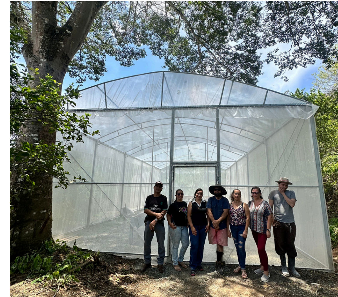
Vivero ADI de Ococa, Acosta