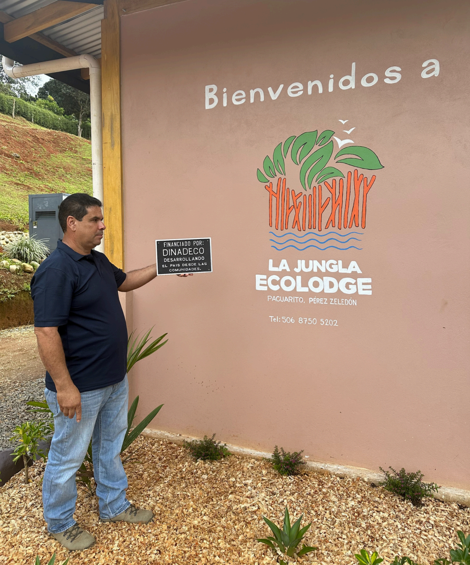
La Jungla Ecolodge ADI Pacuarito de Pérez Zeledón

En Dinadeco articulamos esfuerzos con los sectores: