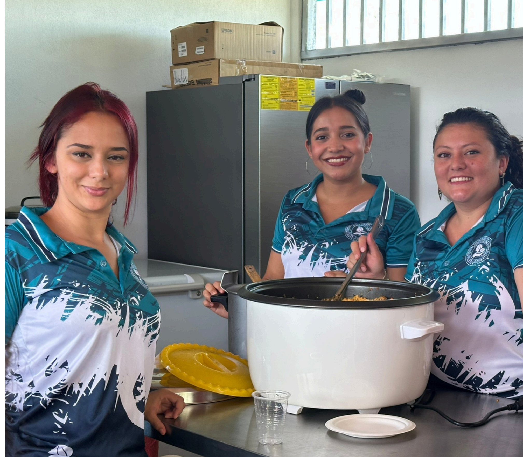
Cancha sintética y soda ADE para el Bienestar y Promoción Sociocultural de la Mujer en Siete Colinas de Gutiérrez Braun, Coto Brus