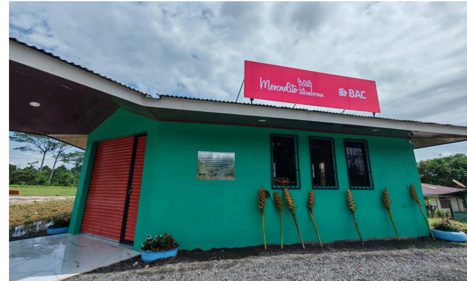
Supermercado ADI La Argentina de Pocora de Guácima